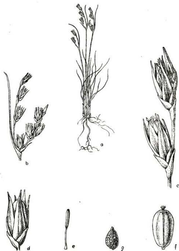
Fig. 1. — Juncus cordobensis sp. nov., Córdoba, San Justo, Concepción del Tío. Leg. Castellanos LIL. 15398, 6/XI/1952). a) Facies, x 1/2; b) Inflorescencia, x 1,5; c) Detalle de la inflorescencia, x 5; d) Flor, x 5; e) Estambre, x 10; f) Fruto, x 5; g) Semilla, x 33.