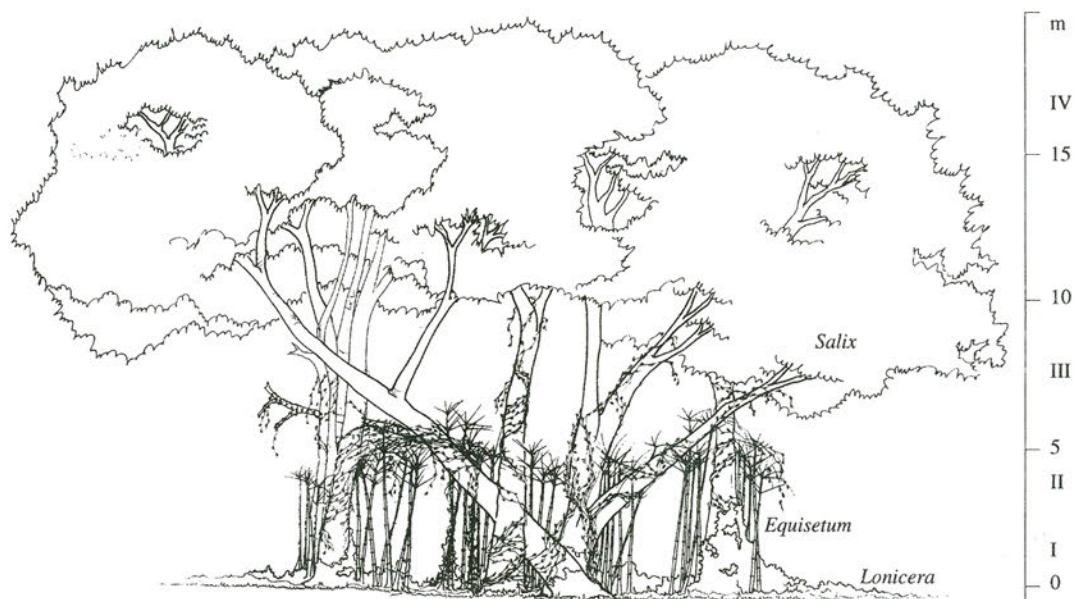
Fig. 2. Estratificación del bosque de Salix fragilis L. ( Salix fragilis con Lonicera japonica ). A la derecha altura y número de estratos. Estrato I: herbáceo bajo muy poco conspicuo; II: de lianas alto y bajo; III: arbóreo bajo; IV: arbóreo alto. Lunlunta, Luján de Cuyo, Mendoza, Argentina (26/VI/1990).

Phragmitetea R. Tx. et Prsg 50 (Méndez, 1984), etc., entre otros.