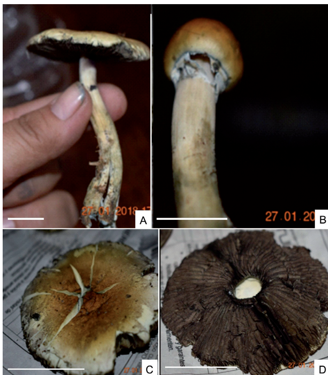
Fig. 1. Basidiomas de P. cubensis . A) Basidioma maduro. B) Especimen joven. C) Detalle de la superficie del pileo. D) Detalle de las laminillas. Albán et al. s/n (CTES). Escala: 20 mm.