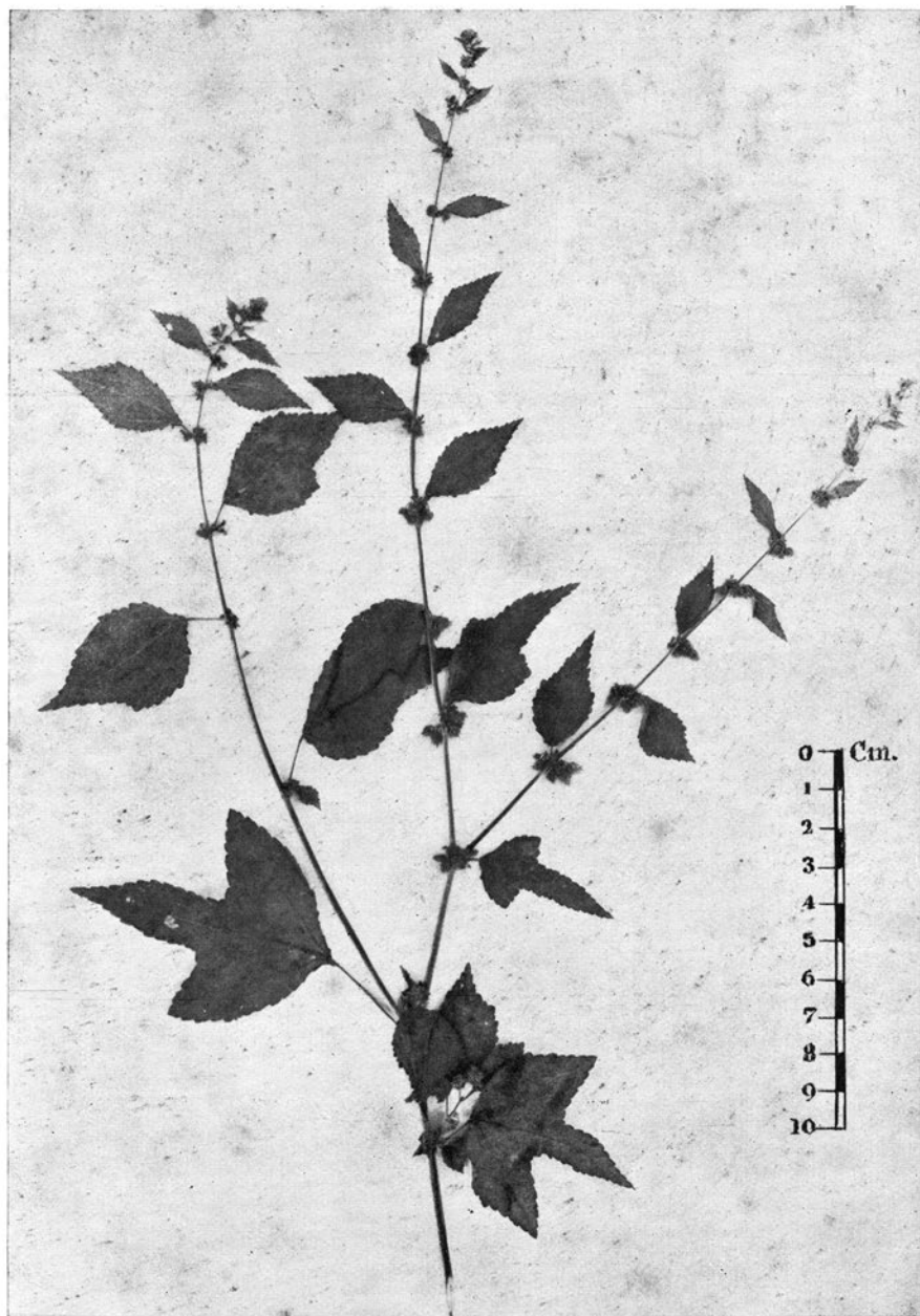
Triumfetta Sampaioi H. Monteiro nov. sp.