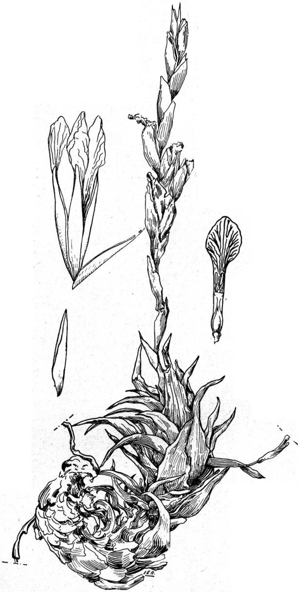
Tillandsia Peiranoi Castellanos n. sp. \pm \frac{1}{4} . Flos \pm \frac{3}{4} . Petalum, stamina et pistillum = \frac{2}{4} . Sepalum \pm \frac{3}{2}