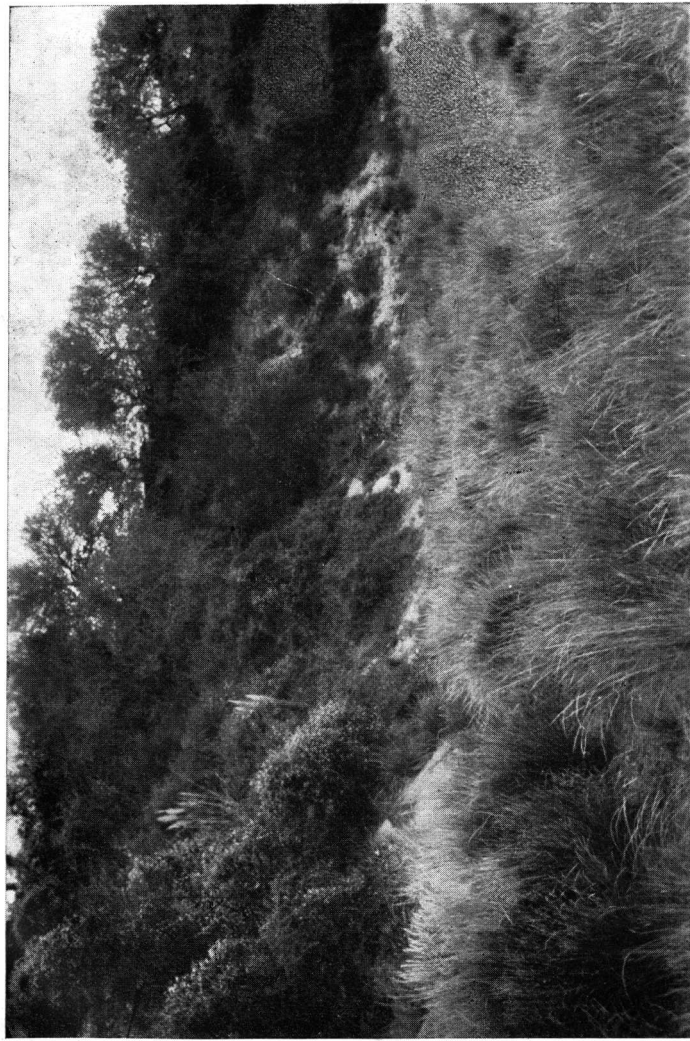
Barrancas del arroyo del Cerro Colorado en la Sierra de la Ventana (Buenos Aires)