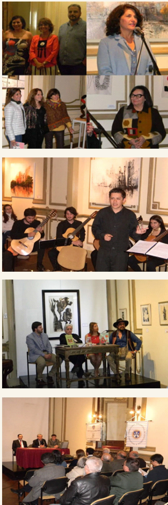
Imágenes de diferentes inauguraciones de muestras de arte y diversas actividades en los salones del Centro Cultural.