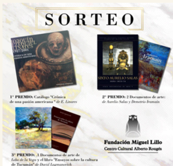
Sorteo de publicaciones del C. C. Rougés.