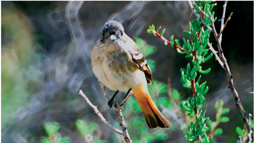
Figura 4. Ejemplar hembra de Knipolegus hudsoni fotografiado luego de la salida del nido. Nótese el vientre blancuzco, el pecho flamulado (estriado difuso).

al nido, sino que se posó primero en la chilca ubicada junto a la cavidad, y luego se desplazó por el interior de ésta hasta alcanzar el hueco. En dos ocasiones, se registró su ingreso al nido, observación realizada detrás de la vegetación, y a una distancia de 4 y 30 m respectivamente. No se observó ningún macho cerca de esta hembra. Fitzpatrick (2004) señaló que durante el cuidado parental en muchas especies de Tyrannidae, la hembra elabora el nido e incuba los huevos y ambos sexos, por lo general, alimentan a los pichones. Agnolín et al. (2009) no aportaron detalles sobre la conducta de los ejemplares referidos. Al respecto, cabe destacar que observaciones realizadas sobre la viudita chica en Neuquén (Veiga et al. , 2002) documentaron que solamente la hembra fue la encargada del cuidado parental (i.e. alimentación; J. Veiga, com. pers.).