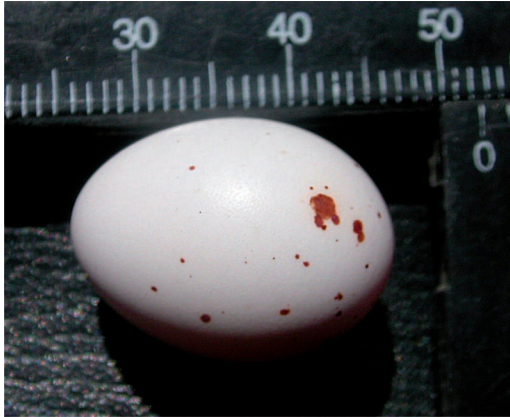
Figura 3. Detalle del huevo de K. hudsoni .

arbustos y en el suelo (De la Peña, 2013). Es notable que otros autores mencionaron para K. aterrimus nidos construidos sobre árboles bajos, arbustos o herbáceas, sin aludir a la utilización de huecos o grietas de barrancas (e. g., Reed, 1919; De la Peña, 1988; Canevari et al. , 1991; Fitzpatrick, 2004; Dardanelli et al. , 2006; Kovacs et al. , 2006). Registros recientes inéditos confirman la utilización de huecos de barrancas y de hendiduras rocosas cerca de cursos de agua y ocultos por la vegetación, en las provincias de Neuquén y La Pampa (J. Veiga com. pers.; obs. pers.) y Río Negro (I. Hernández com. pers.).