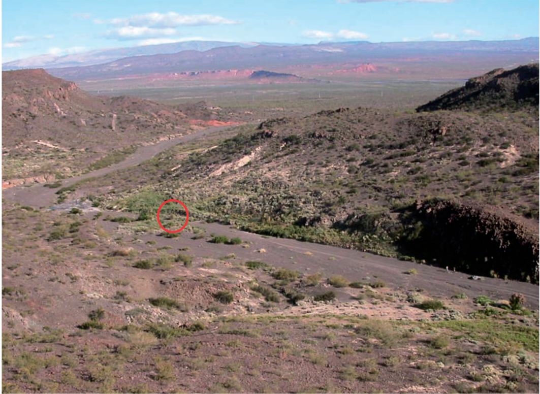
Figura 1. Ambiente de nidificación de la viudita chica ( Knipolegus hudsoni ), en el norte de la provincia de Neuquén, departamento Pehuenches. El círculo rojo muestra la ubicación del nido.

Pehuenches, 37°11'58.48"S; 69°27'57.90"O; 810 msnm) se localizó un nido de K. hudsoni en una cavidad natural presente en los sedimentos de una barranca de baja altura (1,5 m de altura desde la corona), que conformaba la margen izquierda de un curso de agua seco. El cuerpo de agua permanente más cercano al sitio es el río Colorado (ca. 3 km). Durante pocos días al año se registra el escurrimiento de agua superficial, que define surcos de avenamiento, conformados por rodados y sedimentos finos, generalmente arenosos. Estos surcos, marginalmente, se hallan vegetados por Cercidium praecox , Prosopis alpataco , Atriplex lampa , Baccharis salicifolia y Hyalis argentea y, en el lecho seco, por Mentzelia albescens . En las acumulaciones arenosas se desarrollan, además, agrupaciones densas de otras formas como Senecio vira-vira , Suaeda divaricata , Sporobolus rigens , Baccharis spartioides , B. darwinii y Distichlis sp.