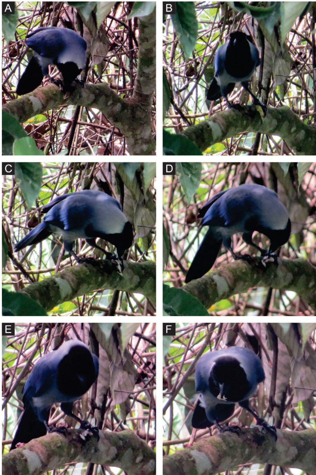
Figura 2. Depredación de Cyanocorax violaceus sobre Dendropsophus reticulatus .