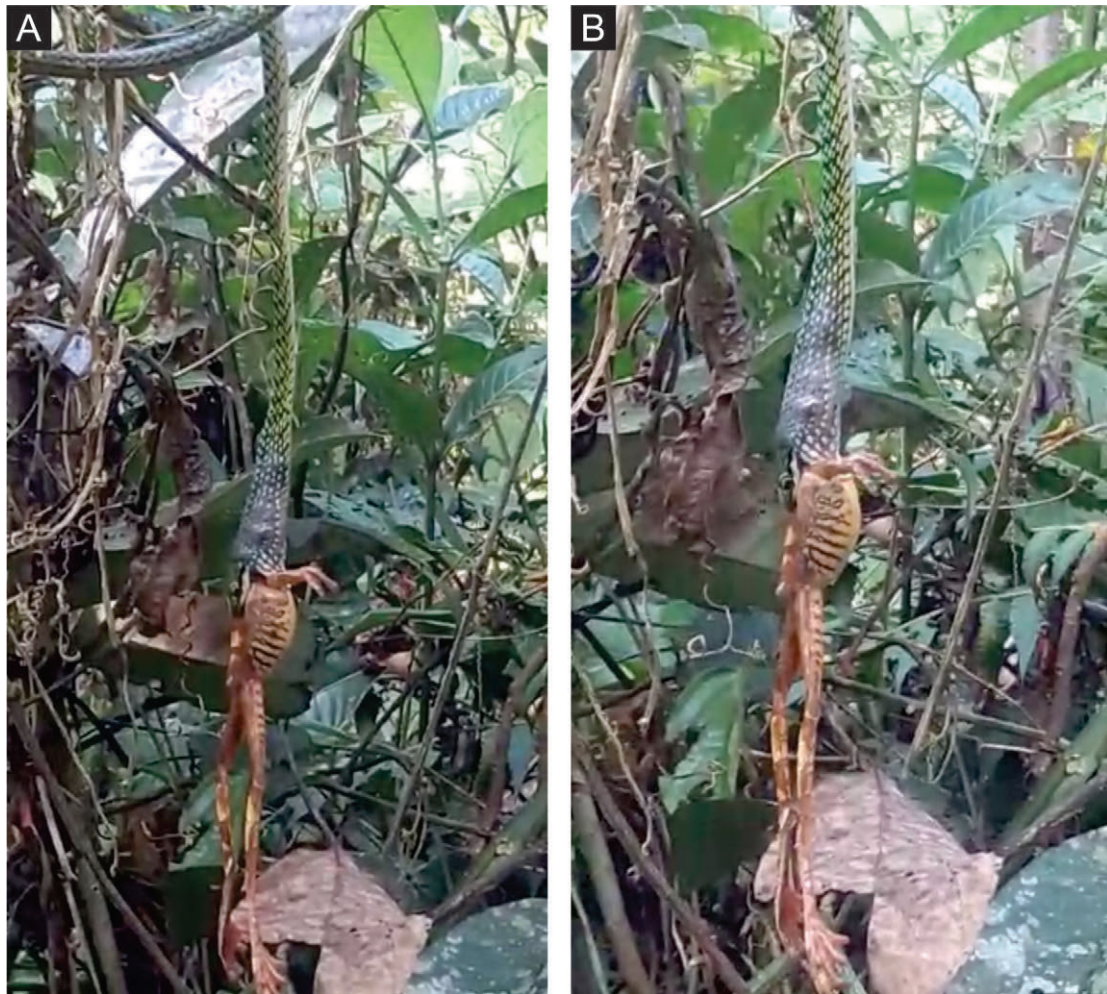
Figura 1. Depredación de Leptophis cupreus sobre Boana appendiculata .