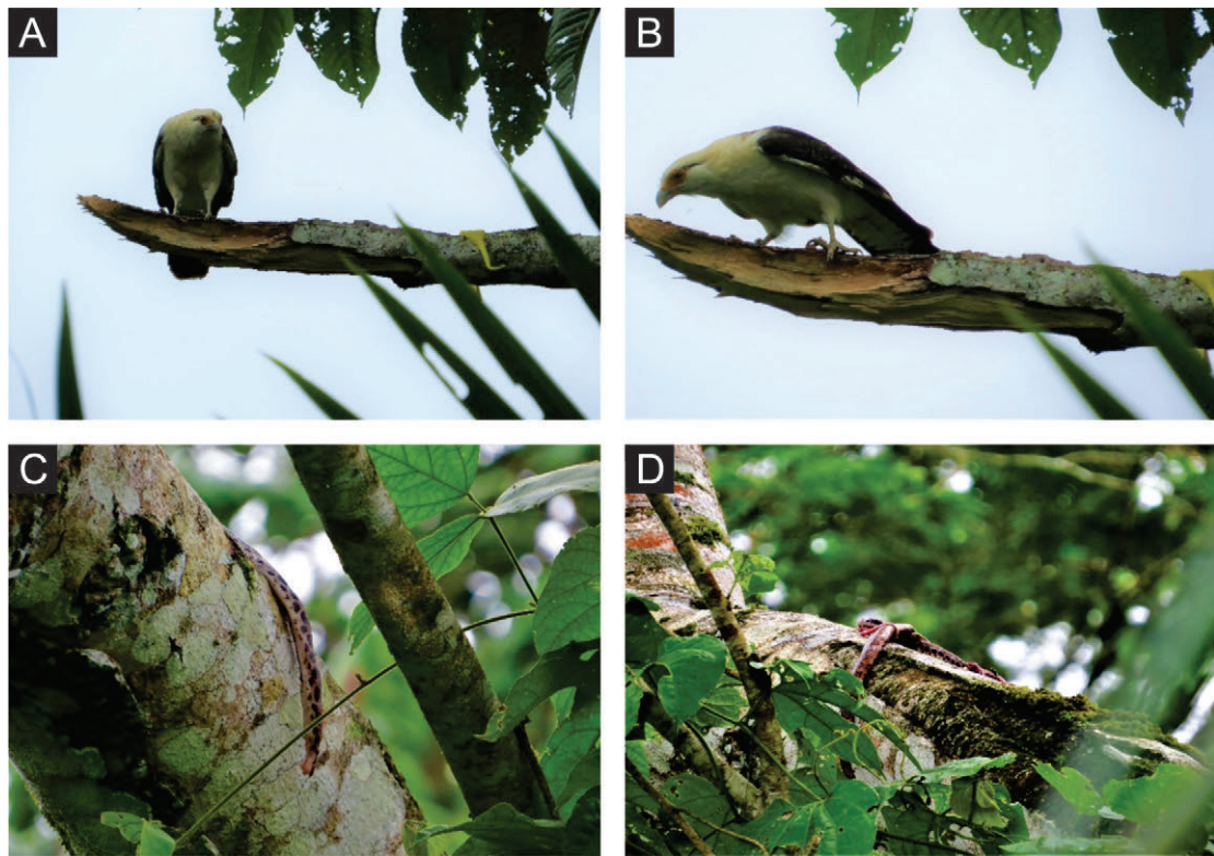
Figura 4. Depredación de Milvago chimachima sobre Epicrates cenchria .