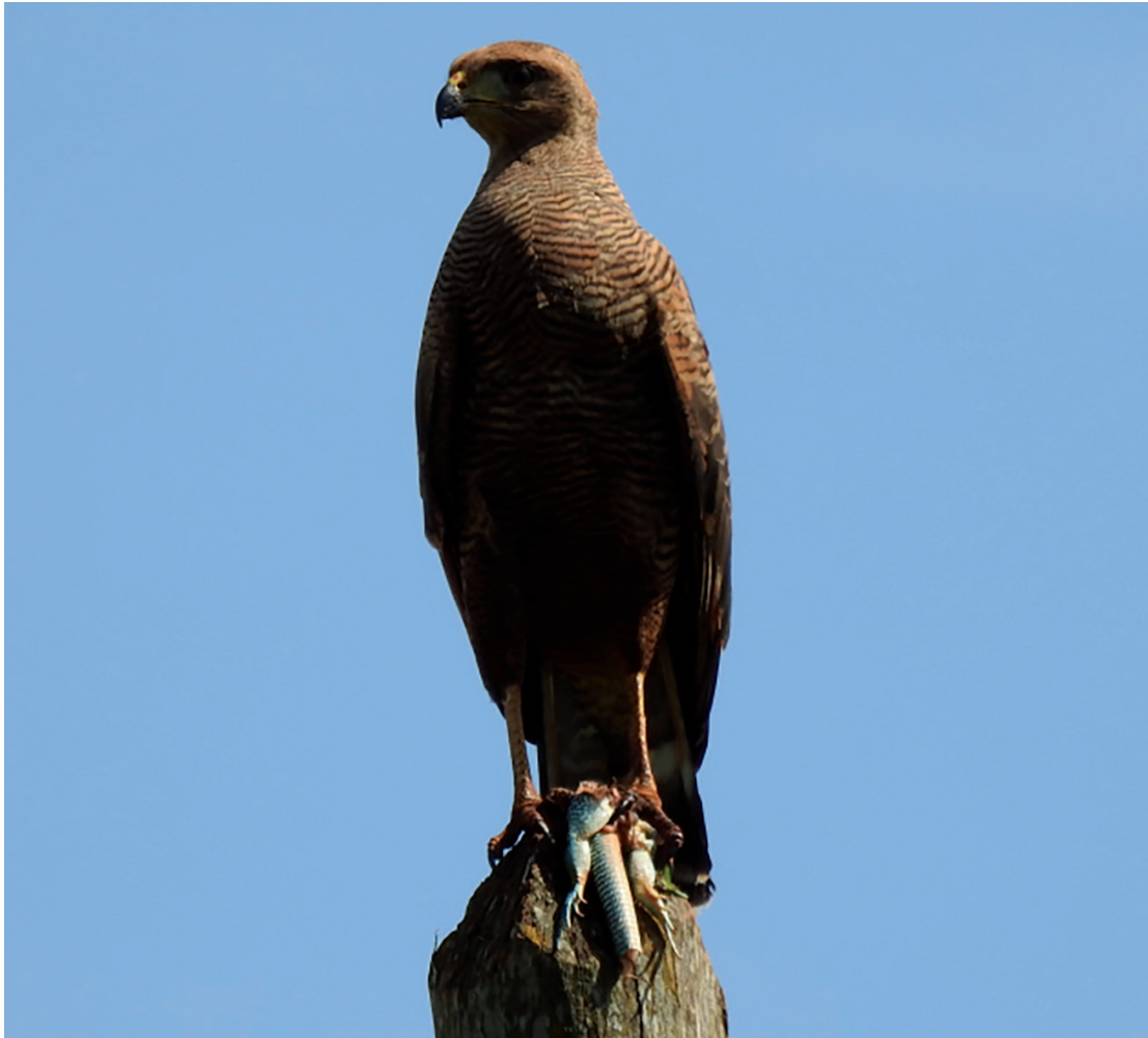
Figura 2. O gavião segurando o lagarto enquanto permanecia alerta.

Figure 2. The hawk holding the lizard while staying alert.