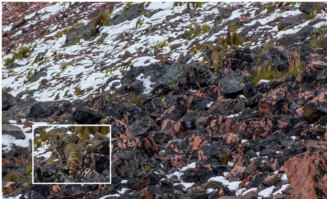
Figura 2. Registro fotográfico del gato andino ( Leopardus jacobita ) en Pitumarca, Perú.

Figure 1. Andean cat ( Leopardus jacobita ) distribution and new record in Peru. a – Distribution range of L. jacobita , previous records (red) and new record (yellow); b – Location of the new record obtained in Pitumarca, Peru (yellow) and nearest previous record (red). Yellow lines represent highways. To the North, the “30C” (Interoceánica Sur) highway and to the South, the “Av. Progreso” highway.