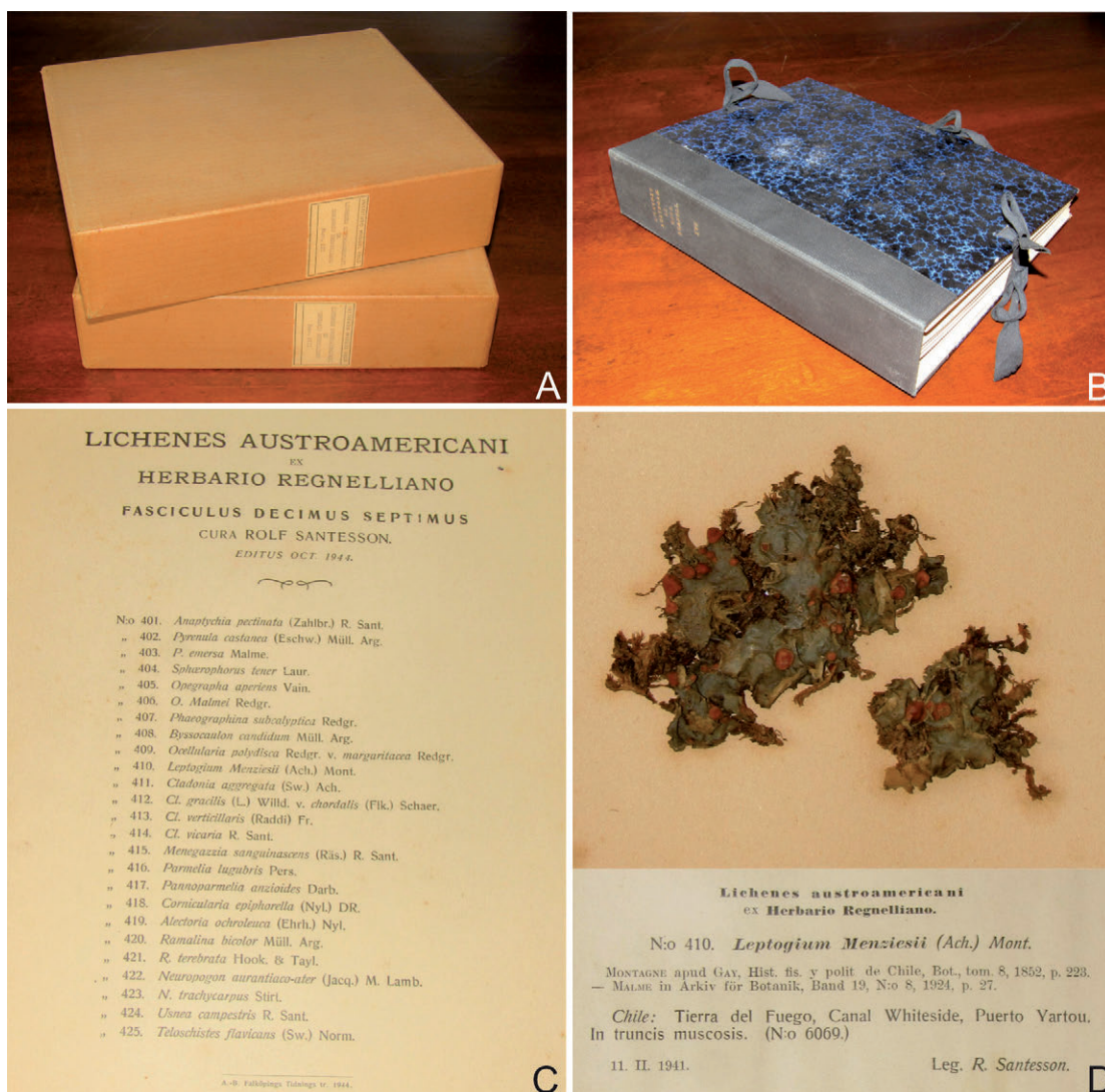
Fig. 1. A) Fascículos rotulados y numerados. B) Carpeta contenida en cada fascículo. C) Índice de los 25 especímenes contenidos en cada carpeta. D) Especimen líquénico: Leptogium menziesii (Ach.) Mont.