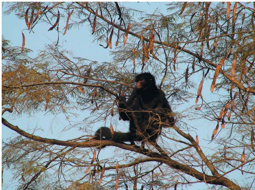
Figura 1. Mono araña negro hembra, Ateles paniscus , sentada en las ramas de un cebil colorado ( Anadenanthera colubrina ), en la pequeña isla de la Reserva Experimental Horco Molle, Tucumán.

1. Locomoción: el individuo se desplaza de un punto a otro en el espacio, usando miembros anteriores y posteriores o solo posteriores (cuadri o bipedalismo, respectivamente), rápido o lentamente, por el suelo o